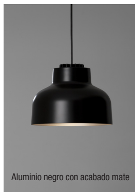
Aluminio negro con acabado mate