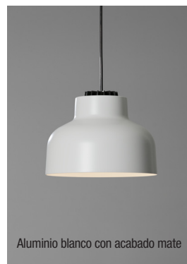
Aluminio blanco con acabado mate