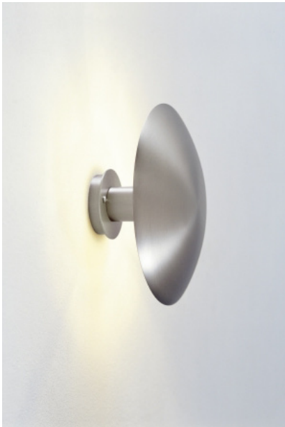
( B ) Disco medium