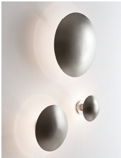
( A ) Disco small, ( B ) Disco medium, ( C ) Disco large

Un disco de acero oculta la fuente de luz y la difunde alrededor de su círculo opaco. La luz se refleja en la pared creando un halo en torno al disco, semejante a la luminiscencia de algunos astros durante un eclipse.