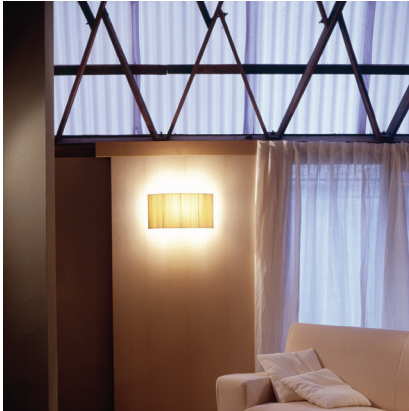
(A) Comodín cuadrado