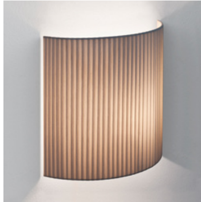
(B) Comodín rectangular