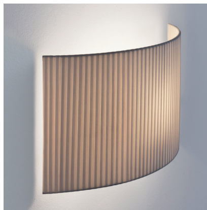
(A) Comodín cuadrado