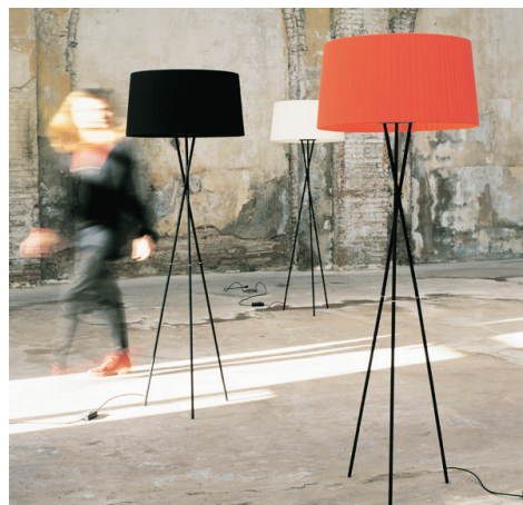
Trípode G5 lámpara de pie