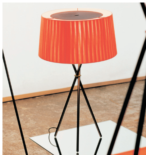
Trípode G6 lámpara de sobremesa

Con la lámpara se adjuntan las instrucciones de montaje.