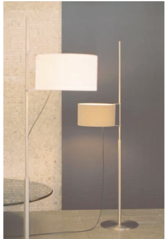
TMD Lámpara de pie

Las instrucciones de montaje se entregan con la luminaria.