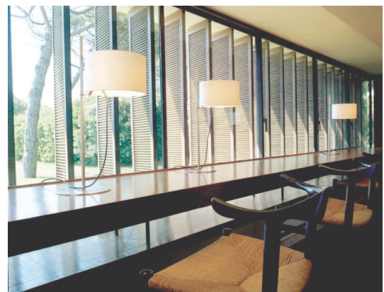
TMD Lámpara de sobremesa