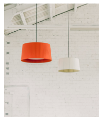
GT5 / GT6