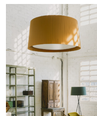
GT1000 / GT1500