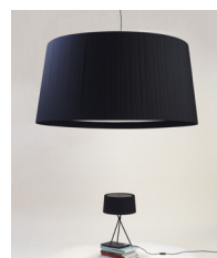
GT1000 / GT1500