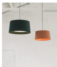
GT5 / GT6