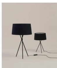
Trípode G6 / M3