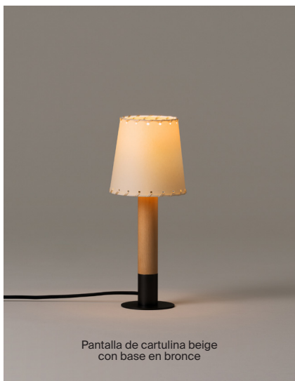
Pantalla de cartulina beige con base en bronce

Santiago Roqueta, Equipo Santa & Cole. 1994 Lámpara de sobremesa