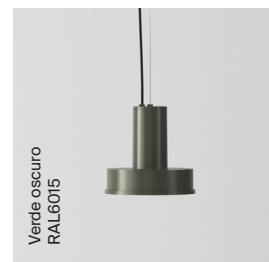
Verde oscuro RAL6015