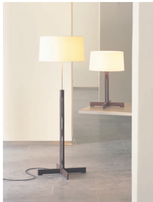
FAD lámpara de sobremesa y pie