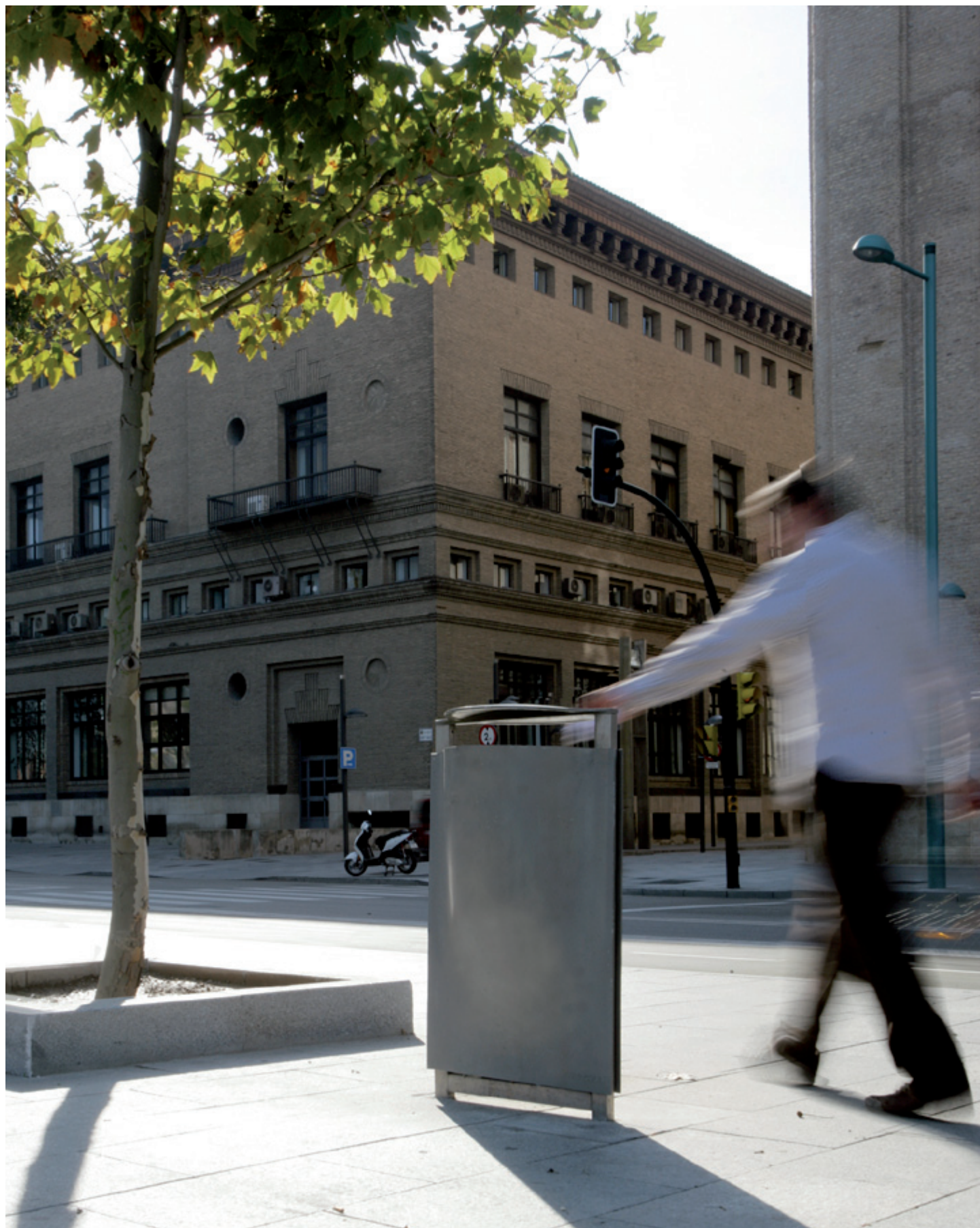
Ribera y margen del río Ebro, Zaragoza (España)