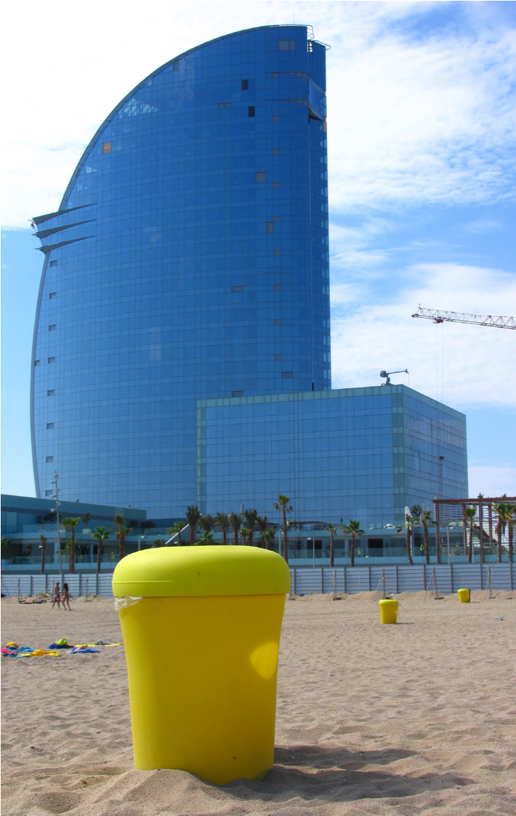
Barceloneta, Barcelona (España)