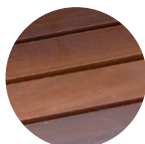
madera tropical FSC