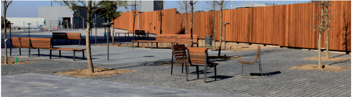
Proyecto para el Ayuntamiento de Sabadell . (España)