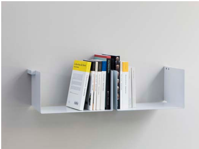
Estantería Noa diseño de Carme Pinós

NOA es un sencillo sistema modular de estantes diseñado por la arquitecto Carme Pinós para construir librerías en la pared. Compuestos por una chapa de acero doblada, los módulos se unen entre sí mediante unos conectores intermedios que son también finales en los extremos. La estantería, de fina sección, alivia notoriamente el peso de los libros en el espacio produciendo la ilusión de que flotan. Los módulos incorporan una rendija posterior para poder pasar cables de altavoces o lámparas, y se ofrecen bien en color blanco, bien en negro.