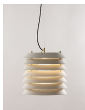
Maija 15 / 30