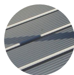
extrusión de aluminio

Con la combinación de dos listones curvados y dos listones rectos apoyados sobre dos estructuras de aluminio, se genera una superficie donde sentarse o apoyarse.