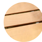
madera de pino